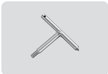
●型式記号・仕様・価格表 □材質 / SUS304