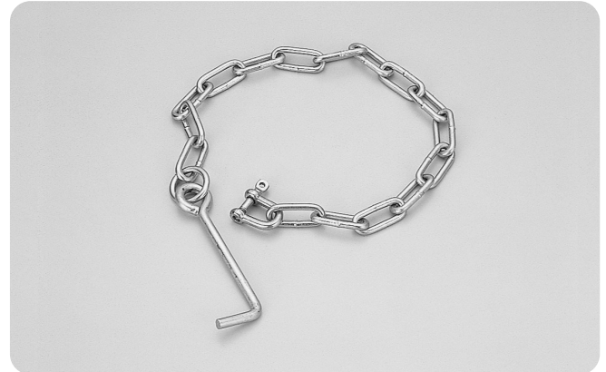
●型式記号・仕様・価格表