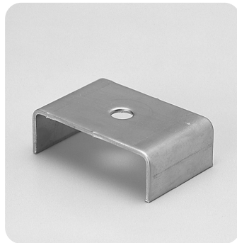
●型式記号・仕様・価格表