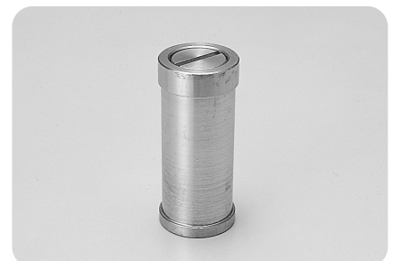
●型式記号・仕様・価格表 □材質 / SUS304