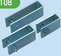
BA (スチール製連結用クリップ)