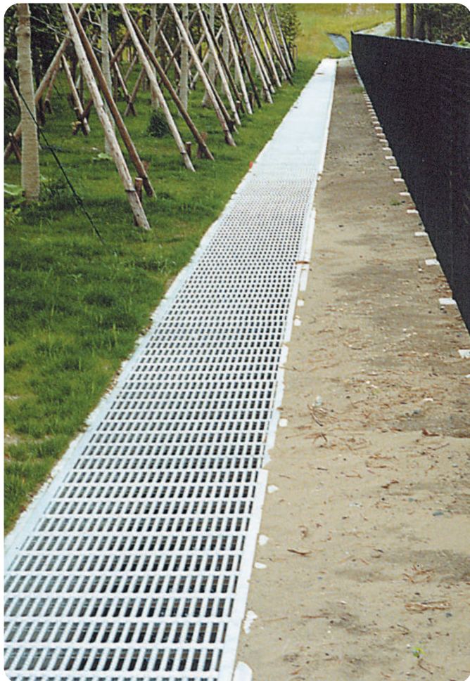
▲クリークウォーク