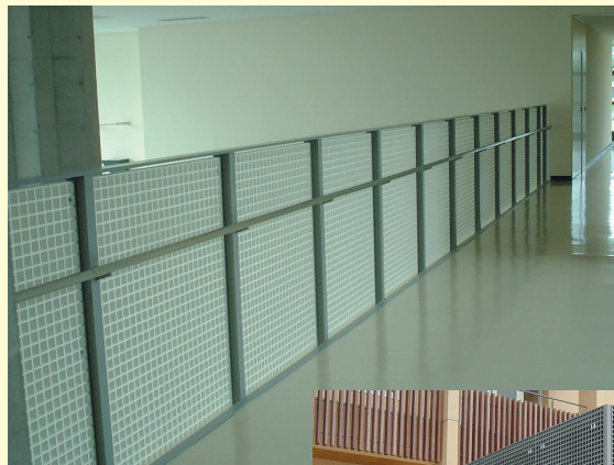
HG-40 (ホワイト色) 落下防止フェンス