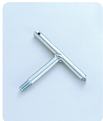
●型式記号・仕様・価格表