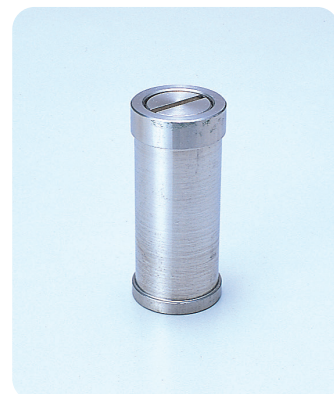
●型式記号・仕様・価格表