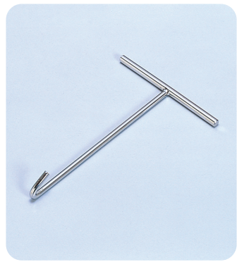
●型式記号・仕様・価格表