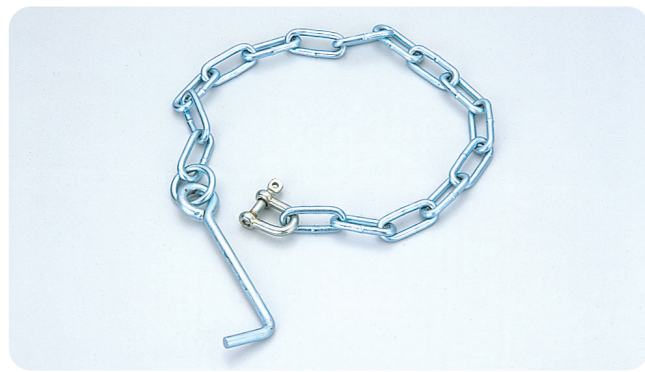
●型式記号・仕様・価格表