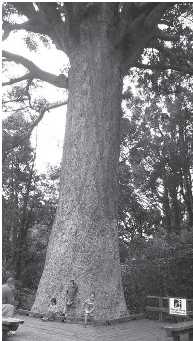
▲カウリの木、樹齢300年。家族との週末

ニュージーランドの人気のスポーツは、何と言ってもラグビー！ オールブラックスは世界的にもトップチームです。試合前に行なわれる伝統の舞『HAKA（ハカ）』は、一度はテレビでご覧になったことがあるかもしれませんが、マオリ文化の特有のものです。鼻と鼻をくっつけてする挨拶 HONGI（ホンギ）や、ニュージーランド国家の一番はマオリ語で歌うなど、マオリ語の継承にも力を入れていて、今でも国全体がマオリ文化を