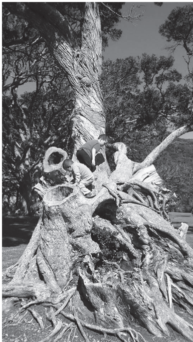
▲自然豊かな公園が沢山

広大な山脈、蒸気の上がる火山、どこまでも続く海岸線、内陸深くまで入り込むフィヨルドや緑深い原生林——ニュージーランドを代表する美しい地形です。大都市でも、1時間ほど車を走らせれば簡単に大自然を味わうことができ、さまざまな動植物に出会う