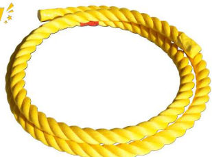
ロープの上を歩いたり引っ張りあったり。 コーディネーショントレーニングに使用できます NK8620 バランスイエローロープ ¥7,535(税込) サイズ：直径30mm×3m 材質：ポリプロピレンスパン