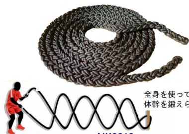
全身を使って振るだけ！ 体幹を鍛えられます。 NK8916 特太ウェーブロープ30 ¥29,700(税込) 重量：7kg カラー：ブラック サイズ：直径30mm×10m