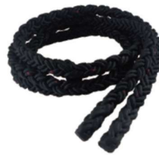
NK8910 ¥5,005(税込) 特太トレーニングロープ 重量：1kg サイズ：直径20mm×3m カラー：ブラック