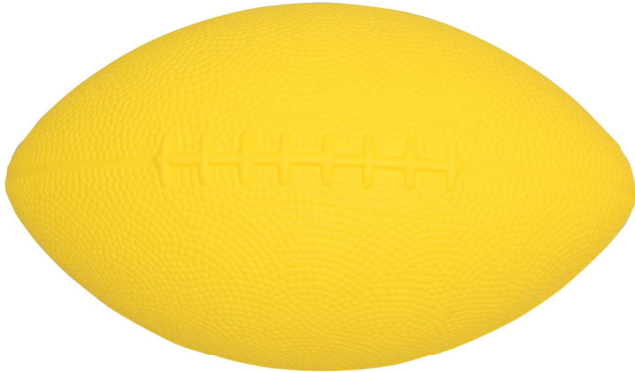
NK5301 ¥2,035(税込) トレーニングミニラグビーボール

ひじに負担のかかりにくい投げ方をマスターできるトレーニングボール ラグビーボールの形状で一回り小さく投げやすい。