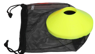
トレーニングの目印スポット 踏んでも安全なポリエチレン製 NK5302 ¥2,145(税込) ミニスポット10 サイズ：直径18.5cm×5cm 重量：約30g 材質：ポリエチレン カラー：イエロー 10個入 収納付き