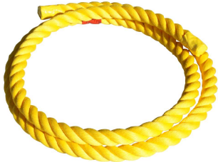
NK8620 ¥8,272(税込) バランスイエローロープ ロープの上を歩いたり引っ張りあったり。 コーディネーショントレーニングに使用できます サイズ：直径30mm×3m 材質：ポリプロピレンスパン