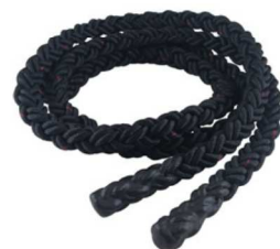
NK8915 特太トレーニングロープM ¥3,740(税込) 重量：0.8kg サイズ：直径18mm×3m カラー：ブラック