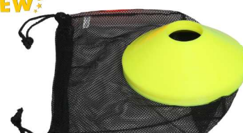
トレーニングの目印スポット 踏んでも安全なポリエチレン製 NK5302 ミニスロット10 ¥2,145(税込) サイズ：直径18.5cm×5cm 重量：約30g 材質：ポリエチレン カラー：イエロー 10個入 収納付き