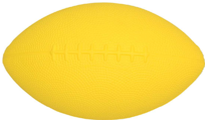
NK5301 トレーニングミニラグビーボール ¥2,035(税込)

※NEW※ ひじに負担のかかりにくい投げ方をマスターできるトレーニングボール ラグビーボールの形状で一回り小さく投げやすい。