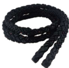
NK8910 特太トレーニングロープ ¥4,620(税込) 重量：1kg サイズ：直径20mm×3m カラー：ブラック