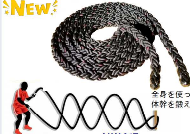
全身を使って振るだけ！ 体幹を鍛えられます。 NK8917 特太ウェーブロープ40 ¥48,400(税込) 重量：12kg カラー：ブラック サイズ：直径40mm×10m