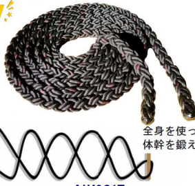
NK8917 特太ウェーブロープ40 ¥48,400(税込) 重量：12kg カラー：ブラック サイズ：直径40mm×10m