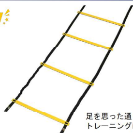
足を思った通りに動かす トレーニングに NK5104 トレーニングラダー ¥8,580(税込) サイズ：W40cm×長さ700cm 重量：約420g 素材：ポリプロピレン/ナイロンベルト カラー：イエロー 収納袋付