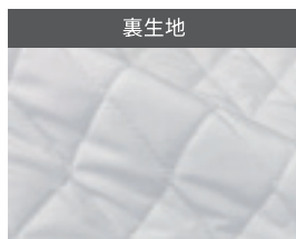
裏生地 中綿キルティング