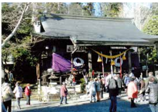
参拝と雪見を楽しむ

日大社より分祀された社で、境内の能舞台は、13代篠山藩主青山忠良が春日神社へ奉納したものであり、国指定の重要文化財です。 ささやま玉水で昼食をおいしく頂いた後は再び高速道を北上。遠阪トンネルを抜ければ但馬の国、一面の銀世界に一同大歓声。神戸に住んでいたら絶対に見られない風景。 つづいて但馬の国一宮