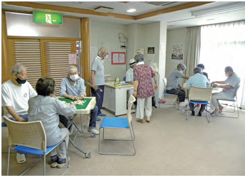
健康マージャンを楽しむ会員