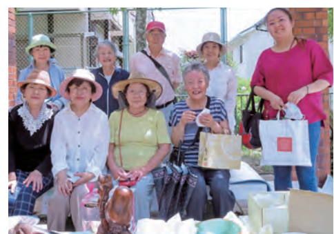
会員のみなさんでパジャリ

ど多種多彩でした。"家の中はスッキリ整理ができ、広くなり気持ちよくなった"との声も寄せられ満足しています。売上金は長年、子どもたちの支援に携わっている「大池チャイルドキッチン」様に全額寄付しました。また、出品物の一部はNPO法人「太陽の家」へ提供しました。また次回のパザールも考えています。