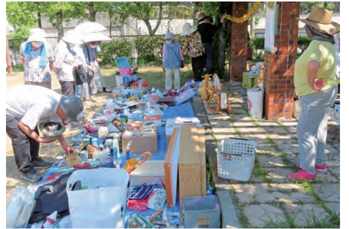
多種多彩なものが並びます

ンドゴルフなどのサークル活動。また、朝のラジオ体操参加や西落合公園の清掃奉仕活動、子どもの登下校見守りなどの活動をしています。今年度も、まだ十分に活動できる状況ではありませんが、サークル活動やボランティアへの参加が増えるよう会員の皆さんに呼びかけて、会員増強に繋げていきたいと思っております。一日も早く新型コロナウイルスが収束して、感染に気を使わなくてサークル活動ができるようになって「健康で楽しく仲間とふれあい」ができる活動となるよう願っています。