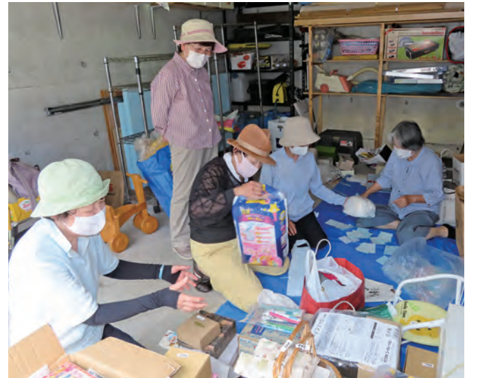
準備のようす（会員さんのガレージにて）

ど多種多彩でした。"家の中はスッキリ整理ができ、広くなり気持ちよくなった"との声も寄せられ満足しています。売上金は長年、子どもたちの支援に携わっている「大池チャイルドキッチン」様に全額寄付しました。また、出品物の一部はNPO法人「太陽の家」へ提供しました。また次回のパザールも考えています。