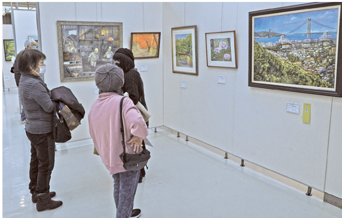
思わず心惹かれる作品

第57回神戸市高齢者美術作品展(神戸市・神戸市老人クラブ連合会・こへ市民福祉振興協会主催、神戸市社会福祉協議会・神戸市老人福祉施設連盟・神戸市民文化振興財団後援・兵庫県神戸県民センター助成事業)を、令和4年12月16日(金)から19日(月)の4日間、兵庫県民会館(2階・大展示室)で開催いたしました。