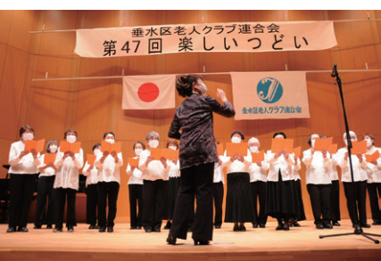
美しいハーモニーが響きます