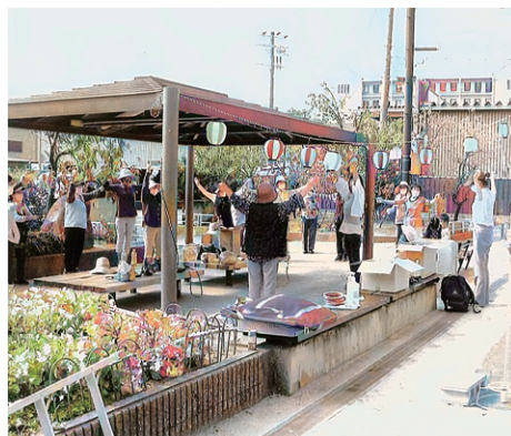
準備体操で身体をほぐす

を設置して完成、これでも子供さんがころんでも安心です。 公園設営の間から流れていたラジカセの音楽で気分が盛り上がってきたところで、老人会の面々とラジオ体操です。参加者が身体をほぐしている間に次々と親子連れが集まりました。ちいさな腕に9本の輪を