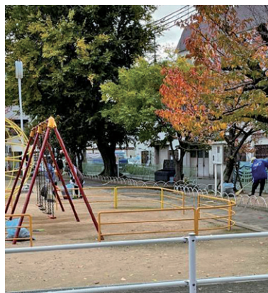
いつもキレイに 気持ちが良い公園

なる今日この頃です。 そんな中、私たちは毎週日曜日の朝8時から9時まで15人程で、公園の落ち葉掃きや雑草取りをしてゴミ袋10〜15袋を集めていきます。日常