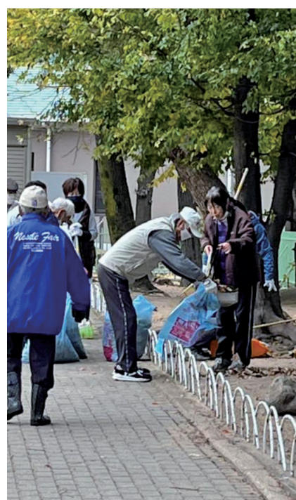
クラブの皆さんで力を合わす

です。そう思い私たちは頑張っています。 役員の方には、公園の花壇の水やりや、地域の中のエコの糞や尿の始末、毎晩懐中電灯を照らしながら見守りを続ける方々がいらつしやいます。そのおかげで西出町