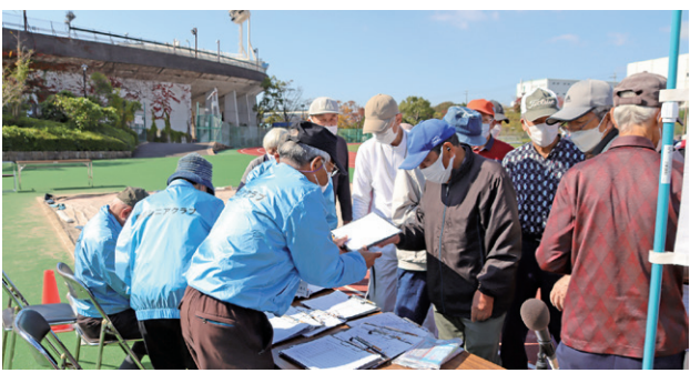
裏方作業も大変です

田丸を披露し、霞ヶ丘健寿会は広い舞台の真ん中で、マジックショーを展開。少しの手違いも愛嬌で喝采を受けた。 10分の休憩のあと、後半の東部老人クラブのコーラス・アイノカタチ。つつじが丘シニアクラブの日本舞踊・おんな七里神楽坂。東部老人クラブの民謡・THE明石海峡大橋。滝の茶屋クラブのダンス。この広い野原いっばいで舞台いっぱい。 神楽台三樹会はカラオケ・白い海峡を独唱。つつじが丘シニアクラブは詩吟・詠富士山と民謡天童下ればを、矢元台むつみ会はリズム体操・八重のふるさと・テネシーワルツを舞台全体で。 最後は狩口シニア倶楽部のコーラス・紅葉と故郷のハーモニーを披露し、全演目を終了した。 「出演者の生き生きとした姿が印象的でした。」