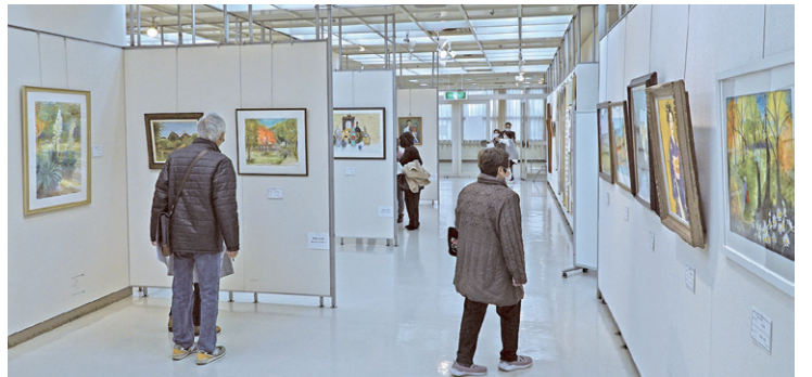
作品総数200点見応えあり!

開催期間中に来場された皆さんの投票による賞の受賞作品は、次の通りです。(敬称略)