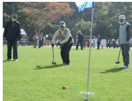
仲間に見られながら

令和4年11月10日(木)、しあわせの村の運動広場にて、秋季グラウンドゴルフ大会を開催いたしました。