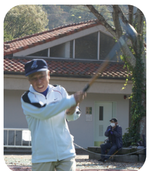
渾身のフルスイング!