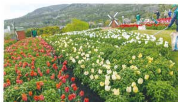
美しきチューリップの丘

4月6日(木)、区老連の花見バスは、車窓に六甲山の山桜を見つつ、田んぼの水面に映す4キロの桜並木で有名なおの桜堤回廊は盛り過ぎ。一路明石海峡大橋を抜け、明石海峡公