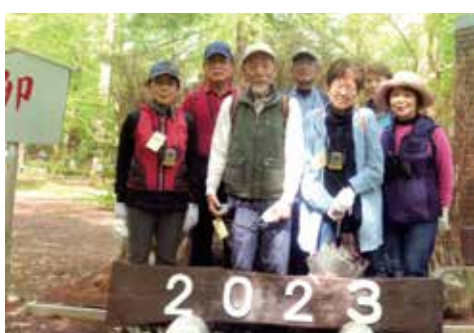
野鳥の会のみなさま

毎月第3金曜日が定例会です。森林植物園、しあわせの村(藍那の里)、菊水山の三方所を月ごとに決めて観察しています。