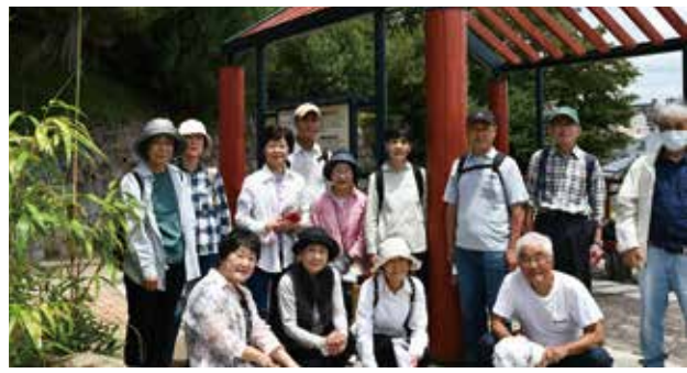
牧野富太郎の植物研究所跡地

月発行し、本年6月号が第100号となった。その配付は役員が会員相互の見守りを兼ねて会員宅を訪問して行うとともに、10戸毎の階段脇と屋外の各掲示板にも掲出し、非会員の当クラブ活動への理解と協力促進にも努めている。