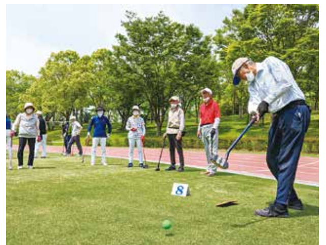
214名が自己ベストめざす

令和5年5月18日(木)、青空が広がり、爽やかな風が吹く中、しあわせの村多目的運動広場にて春季グラウンドゴルフ大会を開催しました。