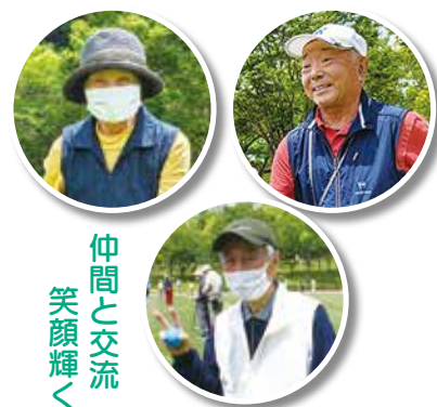
仲間と交流 笑顔輝く

会員の減少を食い止めるためには会員の声かけが大きな力になります。一人でも多くの仲間を増やし、活発に活動していきましょう。