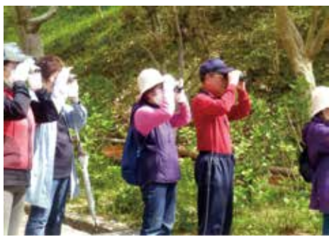
バードウォッチを楽しむ様子