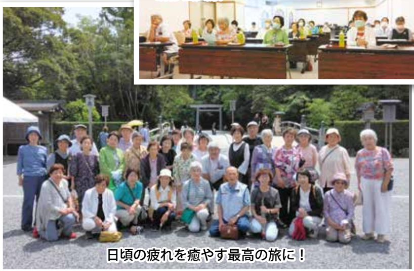
日頃の疲れを癒やす最高の旅に!