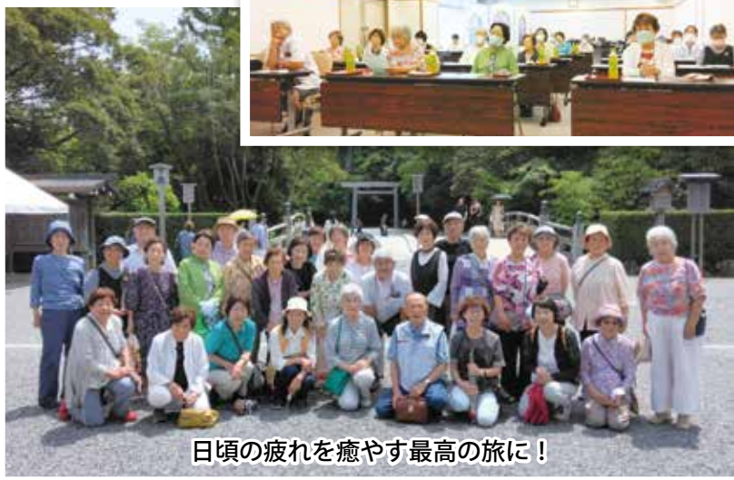
日頃の疲れを癒やす最高の旅に!

兵庫区役所前を出発して三重県伊勢神宮(外宮)を参拝のあと午後3時から当日の宿泊場所である鳥羽・扇芳閣にていよいよ研修会です。18クラブから30名が出席して7名から各クラブの活動について発表されました。内容は定例行事、良かったこと、問題点、悩みごと、区老連に対する要望などです。 それぞれのクラブでは主に輪投げやグラウンドゴルフなどの健康づくりと清掃活動ですが、麻雀教室や手芸教室、カラオケ、その他参考になる活動をされていました。その後は活発な意見交換がなされましたが、問題点はやはり会員の減少です。 研修会終了後は温泉で