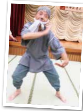
宴会はとてにぎやか!

旅の疲れを流して午後6時30分から食事、カラオケ、どじょう掬いまで飛び出し、終始なごやかに1日目終了。 翌日、午前8時30分に宿を後にして、内宮参拝とおかげ横丁での買物などを楽しみ午後5時30分区役所前へ無事帰着しました。初参加の方々とも親睦を深めることができました。 有意義な研修会となりました。