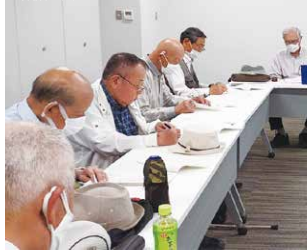
楽しくクラブ運営ができるよう、議論を交わす

できていないクラブもあり、運営がスムーズに行われるよう、北区老人クラブの会則・各専門部会の業務・年度行事の概要などを資料にそって担当の役員・各部長が説明をいたしました。新任の皆さんたちも熱心にメモを取られていました。どのクラブも楽しく運営ができるよう役員会も丁寧にきめ細かく支援していくことが大事かと思えます。北区老連、そして全国のシニアクラブの絆を深めましょう！