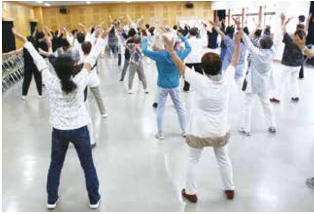
毎日の健康と転倒予防のために

令和5年7月14日(金)、婦人会館5階大会議室にて「いきいきクラブ体操」の指導者養成講習会を開催しました。 この講習は、高齢者が特に低下しやすい下肢の筋力やバランス能力を改善し、転倒予防を目指すとともに、日常生活動作能力の低下を予防するのに役立つ「いきいきクラブ体操」を多くの会員の皆さんに広めるためのものです。