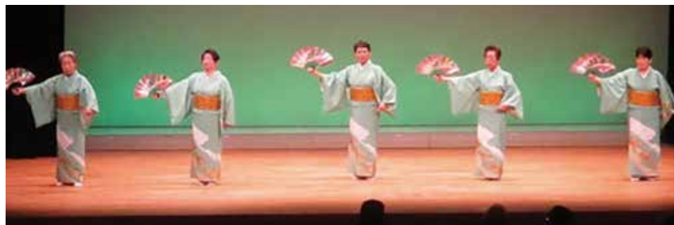
「祝い酒」魚崎つるかめ会