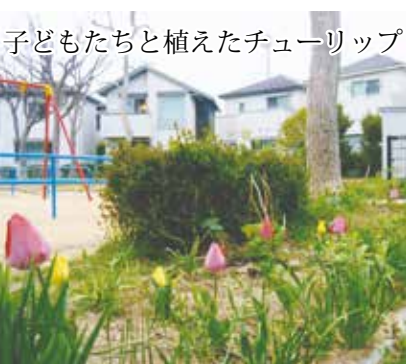
子どもたちと植えたチューリップ

区老連グラウンドゴルフ大会では、初出場、初優勝の栄光を勝ち取りました。サークル活動としてはグラウンドゴルフ、輪投げ、リズム体操を中心に健康増進・健康づくりに取り組んでいます。ところが、3年前グラウンドゴルフの練習をしていた狩口台公園で設備工事が始まると連絡があり、しばらく休み、工事完了の連絡を受けて見に行ったら、グラウンドにジャンダルジム付きの滑り台ができていて、グラウンドゴルフができる状態ではありませんでした。しばらくして、狩口シニア倶楽部が行っている矢元台公園でいっしょに練習することになり、再開しました。