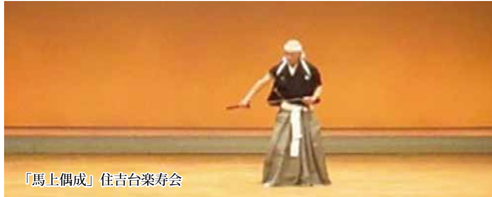
「馬上偶成」住吉台楽寿会