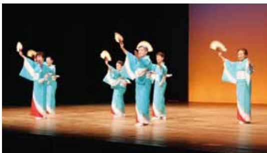
灘区 新舞踊「心機一転」

各区より会場を沸かせる踊りや演奏を披露していただきました。4年ぶりの大会ともあり、さらに磨きのかかった舞台が次々と繰り広げられ、盛大な大会にふさわしい終幕を迎えました。(12ページに関連記事あり)