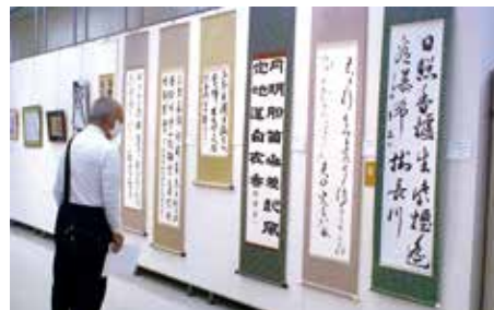
皆さん興味深そうに鑑賞していました

第58回神戸市高齢者・第36回こつへ長寿祭美術作品展を、令和5年9月7日(木)～9月11日(月)までの期間、兵庫県民会館(2階・大展示室)で開催しました。開催期間中には、704名の方々が来場し、力作ぞろいの作品を熱心に鑑賞されました。