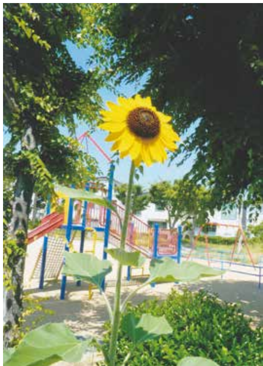
2年前に始めた活動が無事に花咲いた