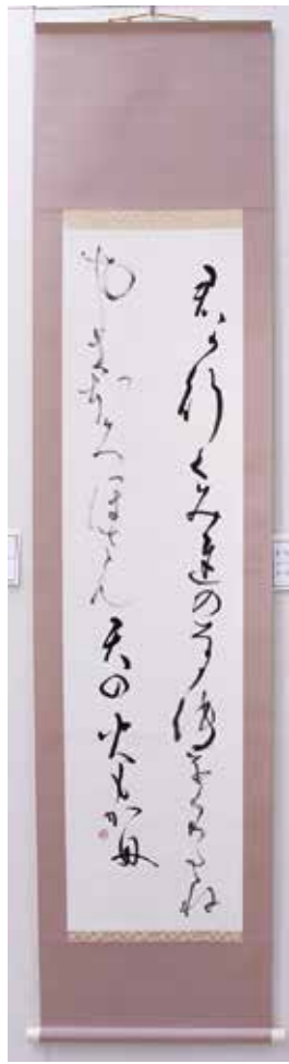
書 金賞作品 万葉集より「君が行く」 久保 治舟