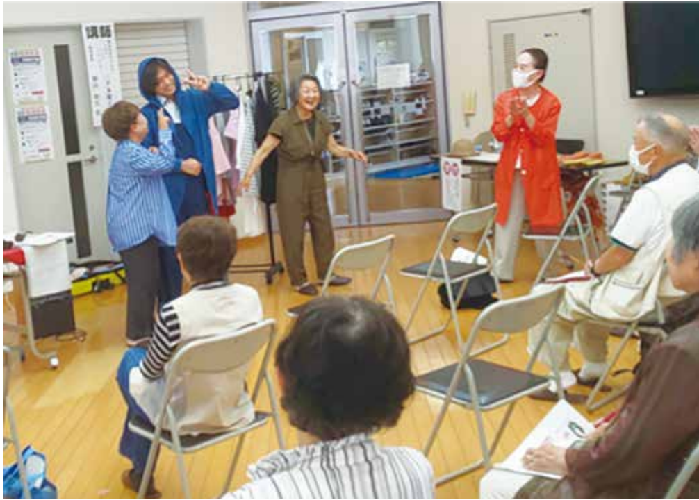
見事な変身に会場は大爆笑