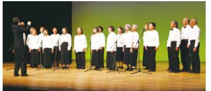
東灘区 コーラス「風になりたい/いのちの歌」