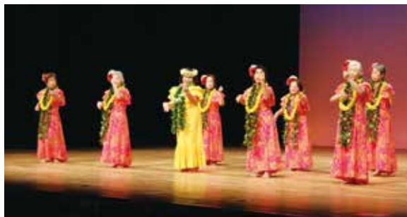
須磨区 フラダンス「A song of old HAWAII」