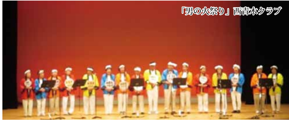
「男の火祭り」西青木クラブ