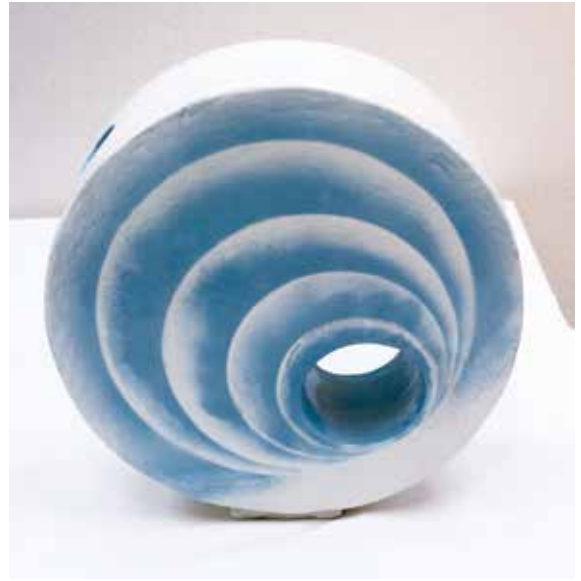
陶芸 金賞作品 「輪紋扁壺」 澤山 幸夫