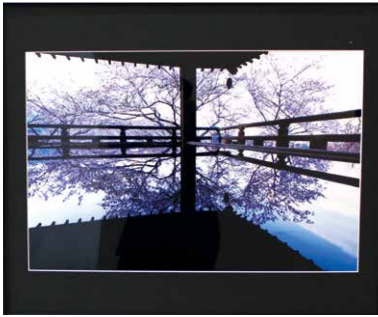
写真 金賞作品 「舞台を彩る」 坪内 太郎