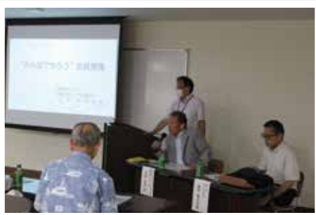
地域とのつながりが活性化の鍵