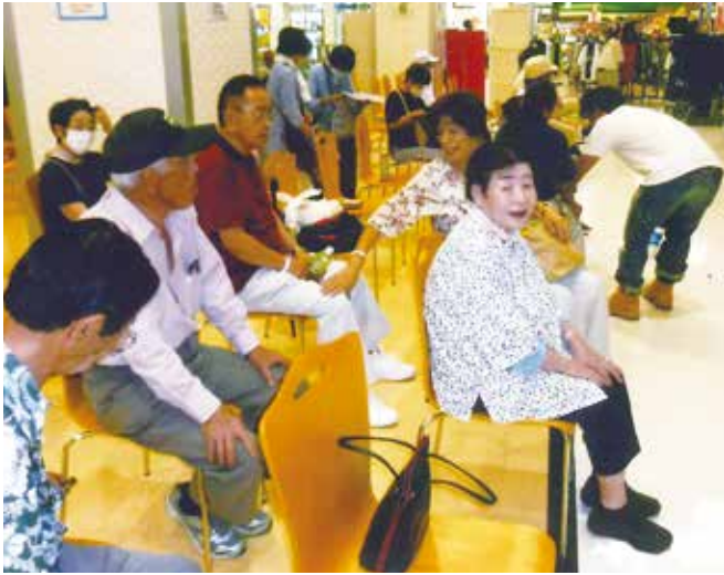
美しい歌声にみなさん聴き入っていました

は令和元年まで約20年、地元のホール(定員70名余)を借り年2回カラオケ大会を実施してました。司会・カラオケ操作は地元会員が行い、観客