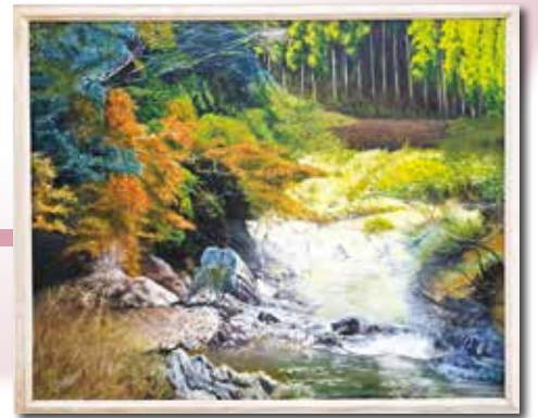
洋画 金賞作品 「霞立つ」 藤本 建治