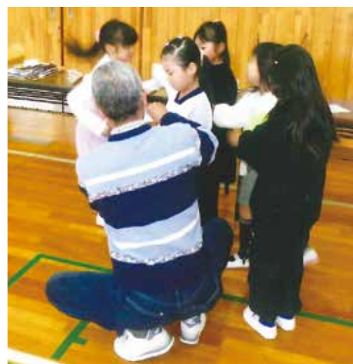
世代を超えて、遊戯に興じる