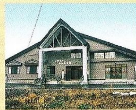
地域交流ホーム「みんなの家」 (友生園)