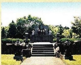
なかまたちの碑 (愛生園)

共同生活住居において、家庭的な環境の基に日常生活上の世話をを行うことにより、利用者がその能力に応じ自立した日常生活を営むことができるよう、適切な援助を提供することを目的とします。