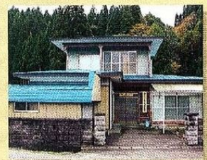
訓練施設「遊参戸」 (阿仁かざはり苑)