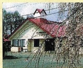
地域交流ホーム「つなかりの家」 (愛生園)