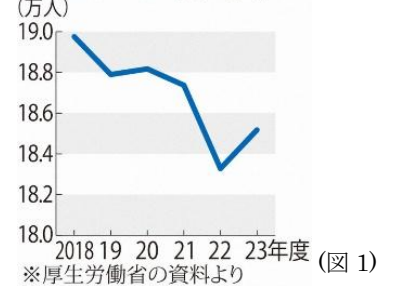
ケアマネジャー数の推移

介護の現場で働く人は 213 万人に上り、ここ 10 年で 30 万人以上増えた。処が、ケアマネに限ると、2018 年度の 19 万人をピークに減少傾向にあります。高齡化も進み、23 年度は 60 歳以上の割合が初めて 3 割を超えました。5 年おきに ケアマネの更新申請が必要ですが、更新時期に再更新しない人が増えており、このままでは 介護需要が最も多くなる 40 年ごろには大幅に不足することが予測されます。(図 1)