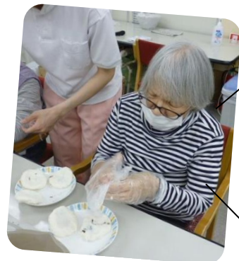
上手く包めるかな?