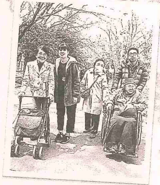
『今年もお花見できて良かったね』

平成29年4月2日(日)お花見日和の中、利用者38人、スタッフ・ボランティア40人の参加で、栄緑道・喫茶ココにてお花見を行いました。今年の桜は3月が低温だったため開花が遅く3~5分咲きでしたが、花を愛で、えんの食卓の特注お花見弁当を食べ、皆さんに楽しんで頂きました。