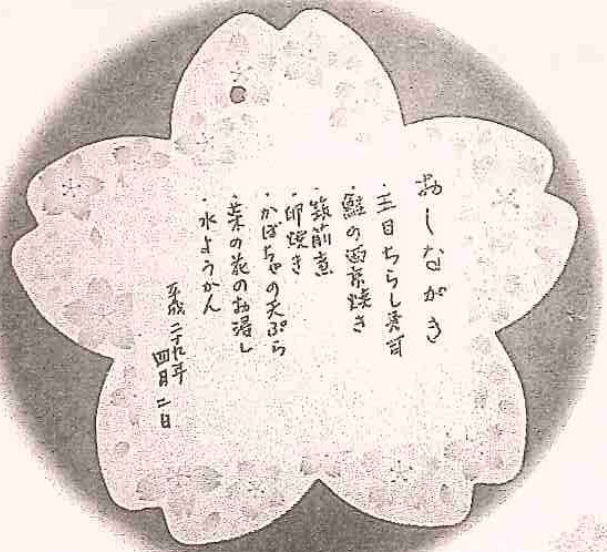
手作りのおしながき