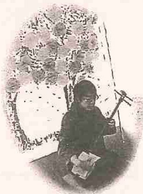
グループホームえん 林スタッフによる三味線演奏