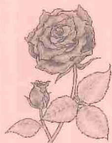
イラスト／細井美風

えんは今のところそこまで切迫していませんが、近い将来大きな影響を受けることは避けられないでしょう。私たち介護事業者にできることは限られています。有料老人ホームなどを運営する大手介護会社が一気に給与をアップするそうですが、有料老人ホームなど介護保険外サービス収入が多い、資産や収入が平均より高い高齢者が対象の事業だからできること。一社だけ、一部の業種だけ賃上げをしても問題は解決されません。少なくとも全職種の平均賃金と同等になるようにすれば、人材が戻ってきます。ただしそのために介護保険料を上げるのはやめていただきたい。