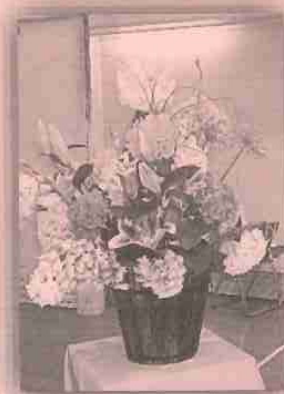
スタッフによる会場の フラワーアレンジメント