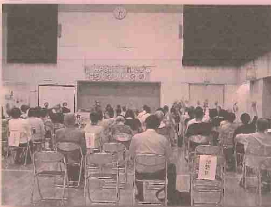
2023年6月25日第21回定例総会

これ以上介護サービスを削減すれば、ヤングケアラーや介護離職が増えるばかり。しっかりと伝え、「改悪」にストップをかけていきます。