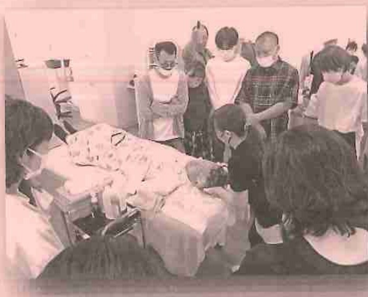
ぬばたま大泉学園店での講習

次に4班に分かれて車椅子の試乗とシャンプー台への移動・移乗を美容師さん同士でおこなってもらいました。基本的なやり方をお伝えしていましたが、「体が大きく立位がほとんど取れない方のスムーズな移乗、移動ができる方法は?」、「立位が取れない方は、美容師数名で抱きかかえているが、ほかにできる方法は?」などまたまた質問が。自分がケアで使っている方法を伝えると、すぐに美容師さん同士で実行する姿を見て本当に嬉しく思いました。最後に行った寝たままの状態での洗髪のデモも美容師さんがモデルをつとめてくださいました。