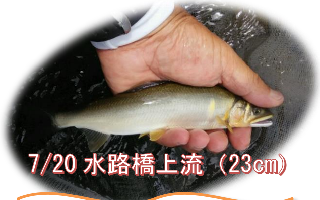
7/20 水路橋上流 (23cm)