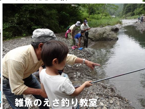
雑魚のえさ釣り教室