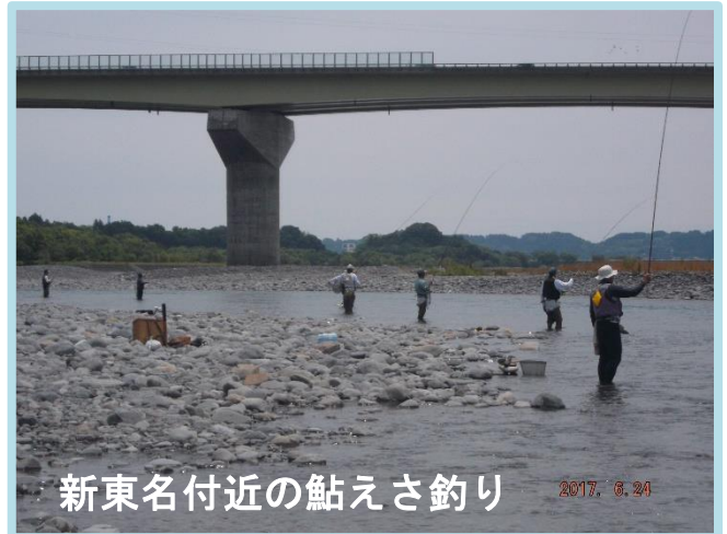
新東名付近の鮎えさ釣り

8月7日の台風5号上陸により、川がリセットされました。シーズン後半、大鮎と出会うことができるでしょうか。