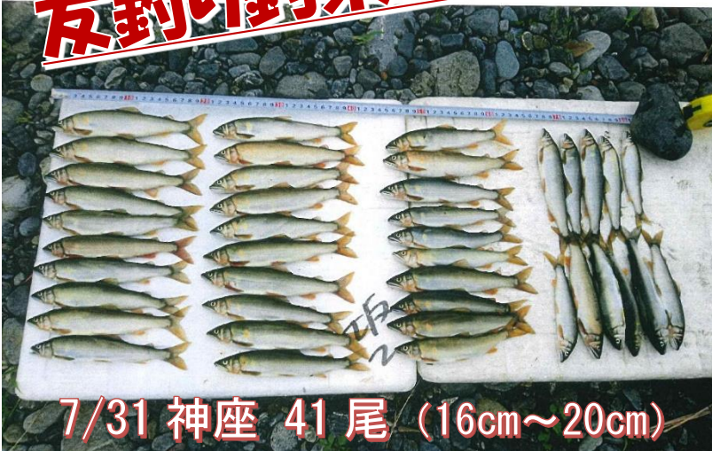
7/31 神座 41尾 (16cm～20cm)