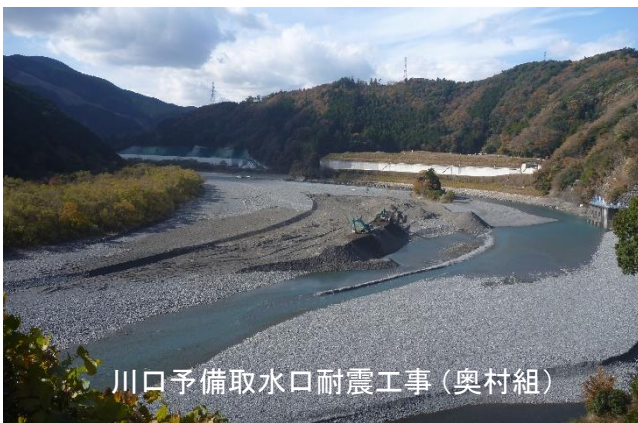
川口予備取水口耐震工事（奥村組）

（工期）H29.11月～H30.5.31完了予定 遡上期に差し掛かることから、工事中に回した右岸側流路で解禁を迎えるよう調整しています。