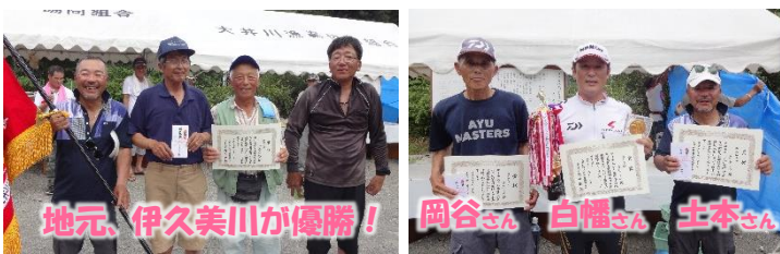
地元、伊久美川が優勝!

8月26日(日)、会場を伊久美川に変更し開催しました。40代～50代の選手が増え始め、大会を通じた親睦が広がっています。