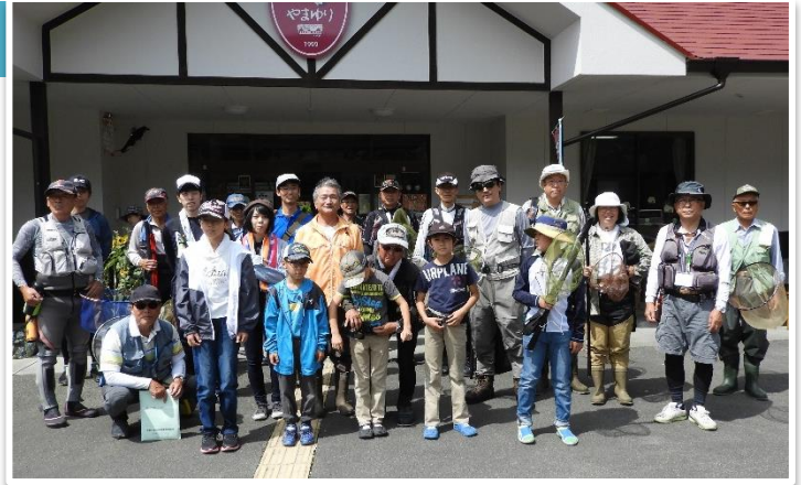
6/22 釣り教室、友釣り参加者 17 人と指導員さん

雨の影響で予備日開催となりましたが、当日を待ちかねた参加者たちが思い思いに竿を振り、釣りを楽しみました。釣りに興味があっても経験するチャンスがないという声が多く、釣りに親しみを持ってもらいたい機会になったのではないのでしょうか。