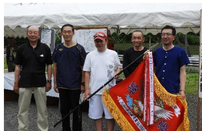
団体優勝 島田地区