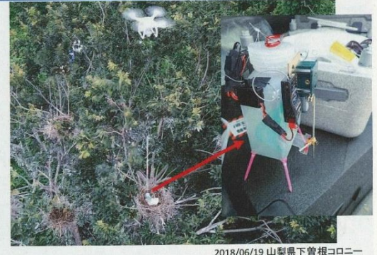
2018/06/19 山梨県下曾根コロニー

実施有無はドライアイスに着色料を混ぜ、卵の色で識別しています。（研修会資料より）