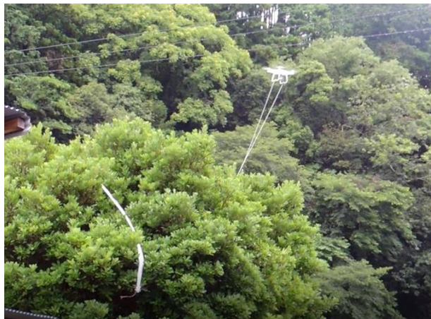
↑木に巣があると見立て、ドローンでビニルテープ張りの実演（1日目）

研修2日目は2台のドローンを使った営巣へのビニルテープ張りが実演され、巣を逃げ出した後、帰れなくなるカワウを目の当たりにしました。