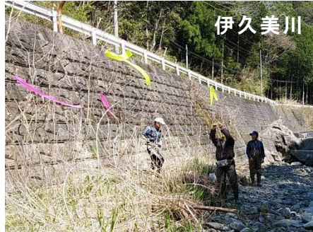
4/9 カワウ除け黒テグス張り