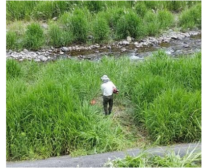
6/6 伊久美川整備（草刈り）