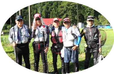
大会大好き！ 「志太の友釣り会」の皆さん

天候や河川環境の悪化などにより3年振りとなった一般友釣り大会は、新型コロナや川の状況から開催の判断が難しく当日は雨も心配されましたが、会場を本流から支流に移し、検温や消毒などのコロナ対策を行いながら、38人が釣果を競いました。開催方法や会場など、今後も参加者に寄り添った大会運営を行いたいと思います。