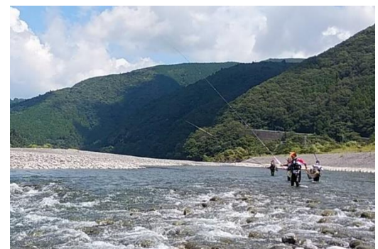
8月下旬 鮎放流後、賑わう大井川（鍋島）

伊久美川では川遊びが上流部まで見られ、釣り人が入る余地がありませんでした。大井川は長雨後に鮎が減少したため8/21、8/27に追加放流をしました。（9/2伊久美川にも放流）