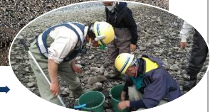
取り残された魚類の救出作業➡