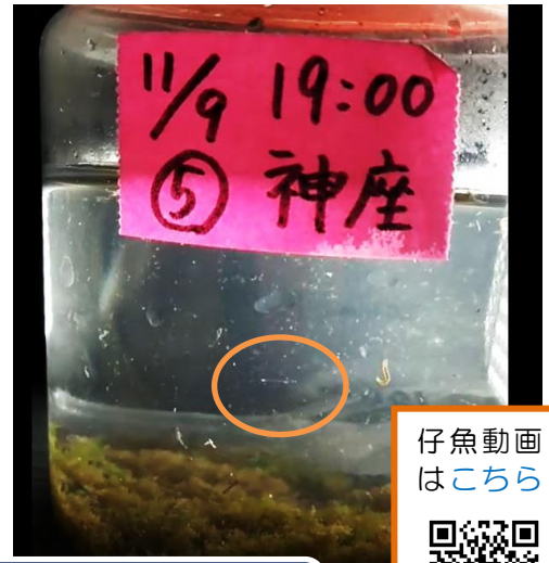
仔魚動画はこちら

方法 ：夕方以降にふ化し河口へ流下するアユ仔魚をプランクトンネットで採捕し計数する。(30分毎5分間)