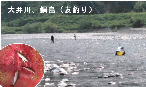
初旬は魚影濃く、鍋島～丹原も賑わいました。