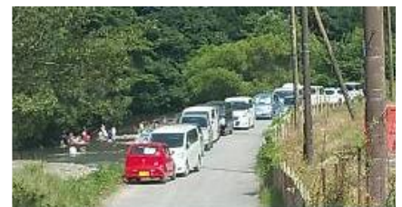
（右）川口橋上流の混雑