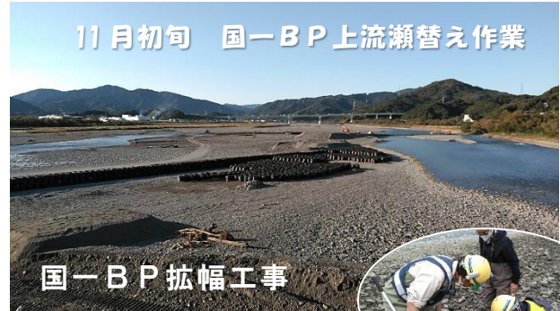
11月初旬 国一BP上流瀬替え作業