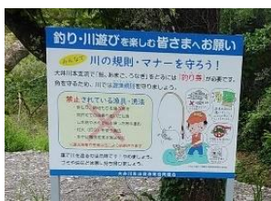
（左）川遊び向けに設置した看板