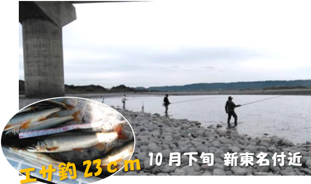
エサ釣 23cm 10月下旬 新東名付近