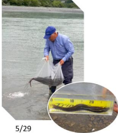
5/29 うなぎ稚魚放流 (約30 g、30 c m 前後)