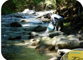
8/29 大久保川などの 6 支流へあまご稚魚放流 (12 c m 前後)

鮎 本支流に計 1,300 kg 大井川 750kg (約 34,000 尾) 伊久美川 550kg (約 56,000 尾) あまご 6 支流に 10,000 尾 うなぎ 計 600 尾