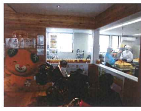
みかんジュースの加工過程を見学!

到着し施設に入ると、みかん ジュースの製造過程を見学で き、じつくりと眺めていまし た。2階からは梅津寺駅や海 を臨め、「きれい」と言ってお ユースを飲みながらゆつくり