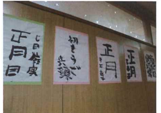
清書を展示しました