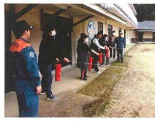
もしもの時のために消火訓練!

3月19日、消防職員、サンヨー防災の立会いのもと火災を想定した避難訓練を実施しました。日頃から定期的に避難訓練を実施しており、その成果もありほとんどの利用者が職員の声掛けとともに落ち着いて避難することができていました。 避難訓練の後には、職員による消火訓練も実施し、消火器の取り扱い方法を改めて学ぶことができました。 訓練後の総評では、実際に火事が起きて避難する際のコミュニケーションの大切さ、普段の危険箇所を把握しておくことの大切さを学びました。利用者、職員ともに真剣に取り組むことができました。協力いただいた消防職員、サンヨー防災の皆様、誠にありがとうございました。