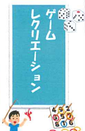
夢中で楽しんでました

ました。出されていた料理のほとんどを食べ尽くし、お腹いっぱいになったところで次の目的地へ移動です。 次はフジグラン大洲へ移し買い物も楽しみました。エスカレーターで何度も上り下りしながらも、楽しそうにお目当ての商品を探していきました。みんな欲しかった物が買えて満足そうに園に戻る事ができました。