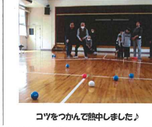
コツをつかんで熱中しました♪

していました。どの利用者も 自分の順番がくると集中した 表情でプレーしていました。 また応援する利用者・職員も も熱が入り、2試合行いまし たがどちらとも利用者・職員 が一体となり盛り上がりつて いました。