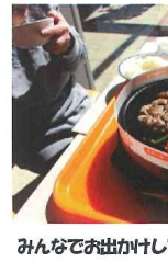
みんなでお出かけして食べるのもいいね!

その後はお買い物の時間で す。店内にはたくさん商品 があり、気になったものを眺 めたり、欲しいものを選んで りてお買い物を楽しんでい ました。