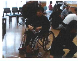
今年72歳になります。

今年72歳になります。 編み物が好きなので、時 間がある時には編み物を し、健康のために踏み台昇 降運動や歩行運動をしてい ます。