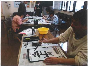
楽しいお正月を思い出しながら

まずは墨を磨るところから始め、書き間違えないようドキドキしながら書き始めました。