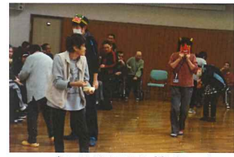
鬼にめかけて豆を投げろ〜♪