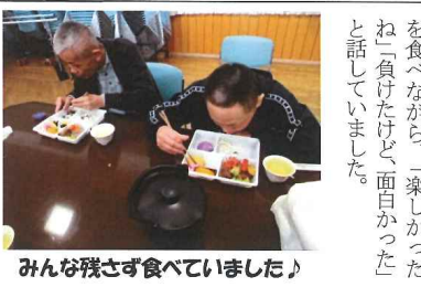
みんな残さず食べていました

二つのチームに分かれて、玉入れ、缶詰みゲーム、釣りゲームを行いました。両チームが白熱した熱戦を繰り広げ、「がんばれ」「負けるな」の声援で会場はさらに盛り上がりました。普段はなかなかやる機会が少ないゲームだったので、利用者も以上以上に笑って切り切っていました。