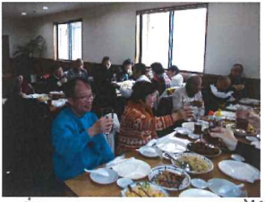
みんなでかんばん〜い