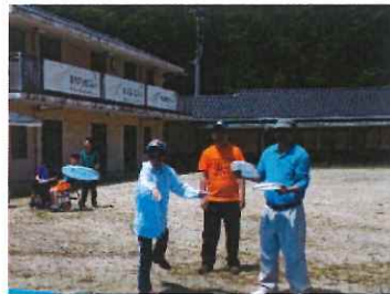
練習の成果を発揮!

試合が始まると選手はみんな集中し真剣な表情でプレーしていました。結果3対8となり、優勝したチームは、表彰式で金メダルを首に掛けてもらい満面の笑顔がみられました。また、準優勝のチ