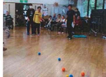
盛り上がった決勝戦!