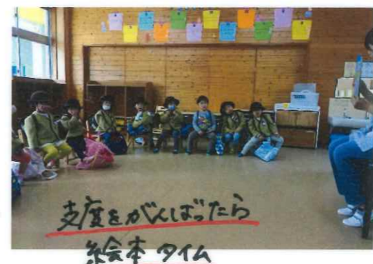
支度をかまひいたら 茶会本タイム