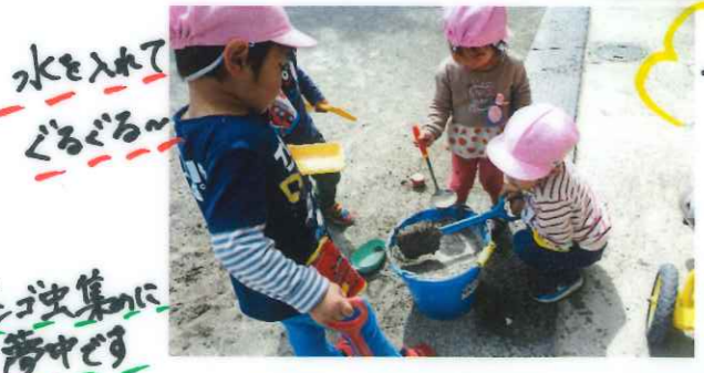
水を入れたくちどるん