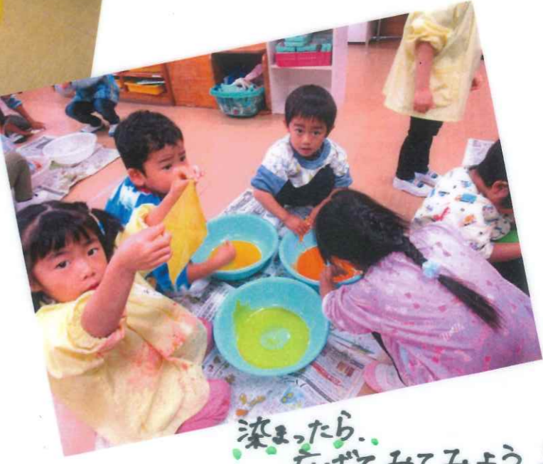
染まったら、 たげてみてみよう!