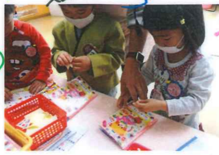
今日は何のソールにしようかな?