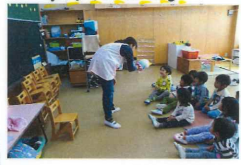
お名前を口ずかしたらタッチできるかな?