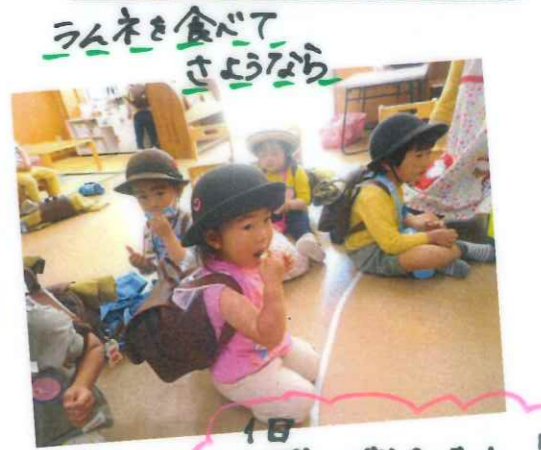
ラムネを食べて さようなら