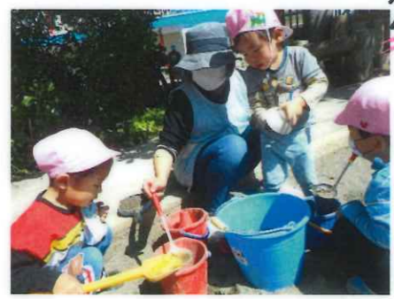
スプーンが使えるかな