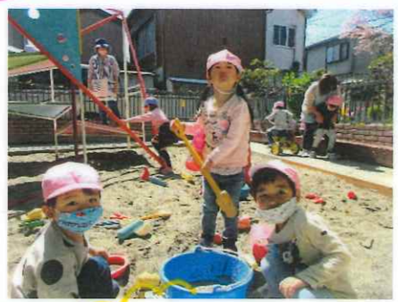
ふじのみさんと一緒に遊ぼう♪