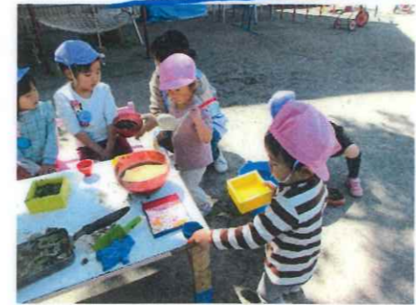
やさしいお兄さん、お姉さんがいます