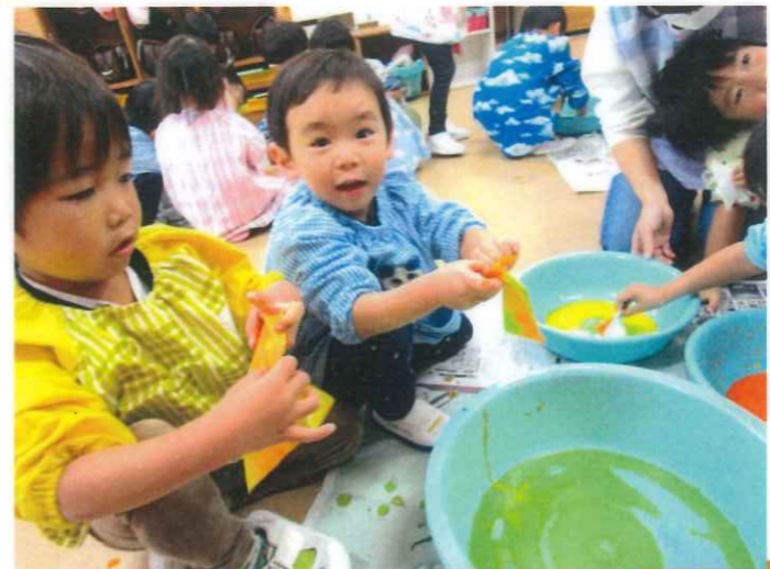
キレイに 模様 になりました