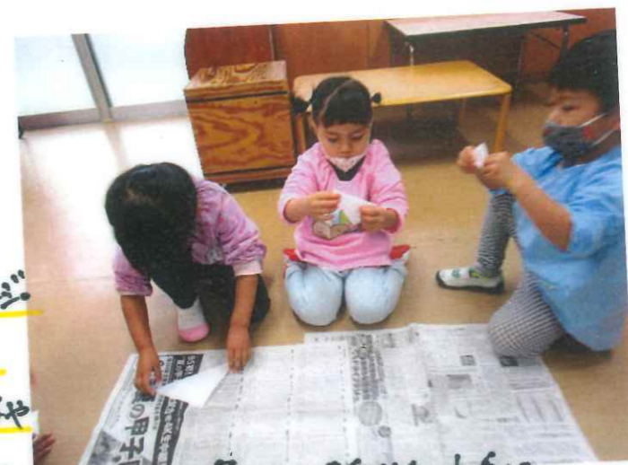
三角お山折りも上手に なりました!