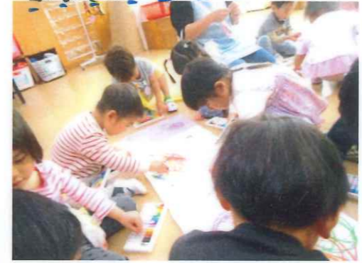
迷子にならないようにお家(箱)に戻りね