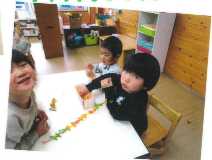
ひも通しと染め紙の葉っぱを 組み合わせて、保育室に 飾っています