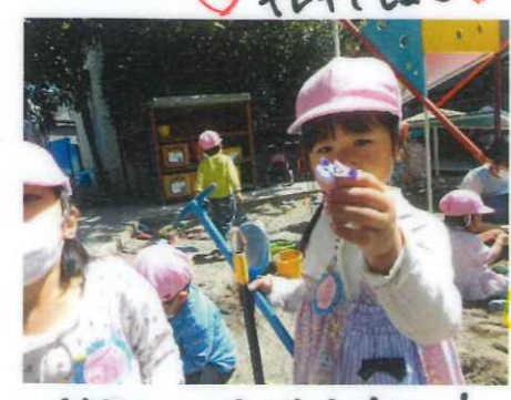
お歌さんにプレゼントするの!