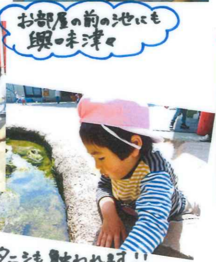
夕ニシも月あわねす!!