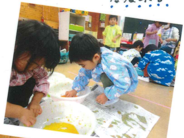
何色にしようかな?