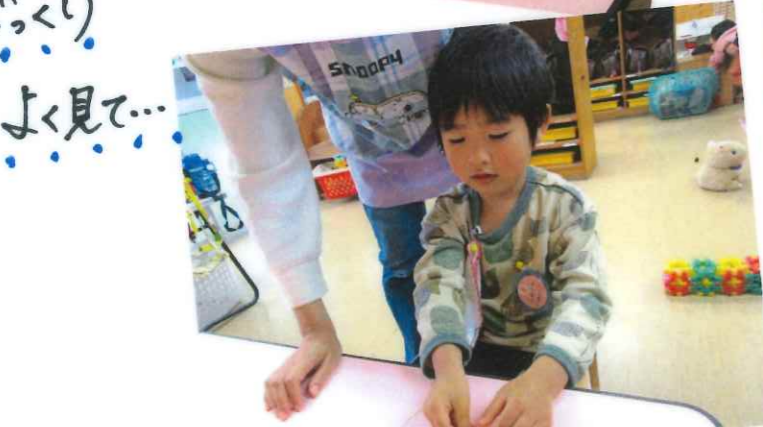
じっくり よく見て...