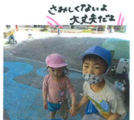
さみしくはないよ大丈夫だよ