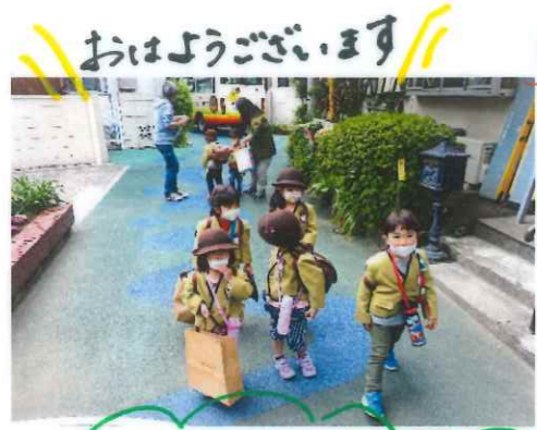
おはようございます