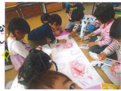
こいのぼりさんをかわいく、元気にしてあげよう!