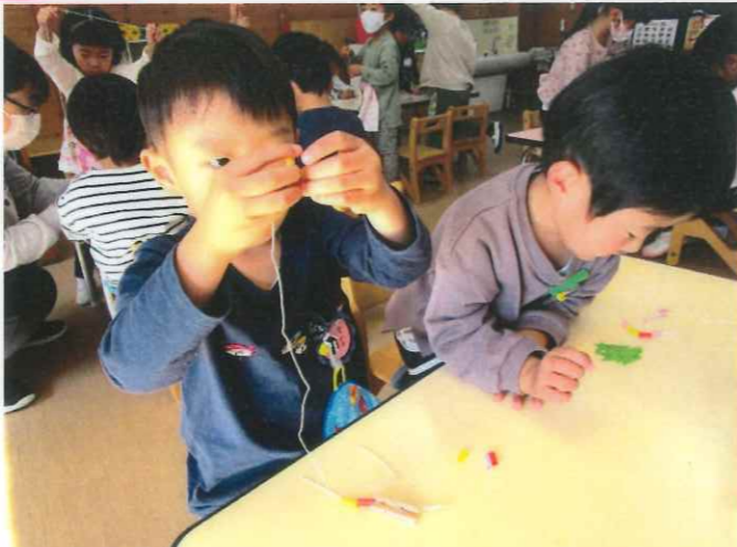
自由あそびの中で、何本も何本も 取り組む子もいました。