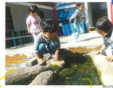
おさかな いるかな たこさん いるかな