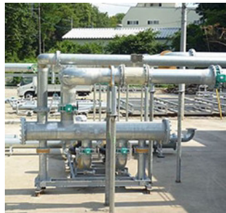
組立後 一次ポンプ側