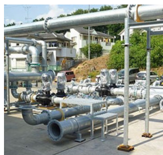
組立後 一次・冷却水ポンプ前側