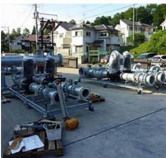
冷温水一次・冷却水ポンプユニット

工場内で製作したユニット、及び配管ユニットをすべて組み立てて、現場設置の状態を工場内で作り確認、及び検査を受ける方法です。