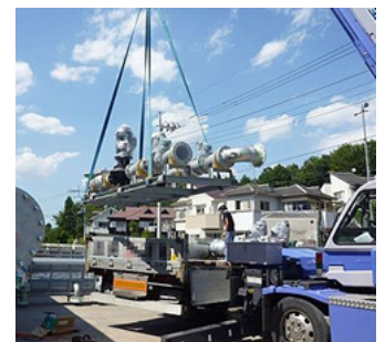
冷温水一次ポンプ搬出