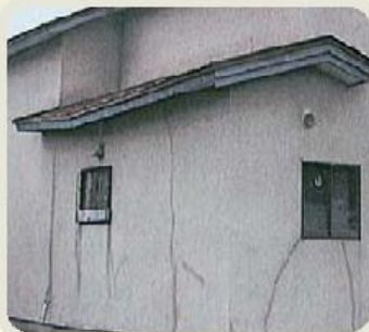
モルタルにクラックが! (ひび割れ)