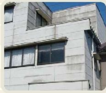
カビや変色が目立ってきた!