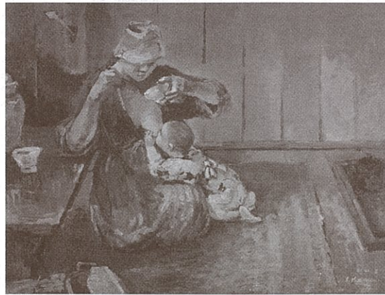
祖父画《忙中の食事》油彩（1947）