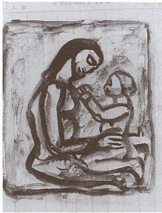
祖父の日記より（ルオーの母子を画く）