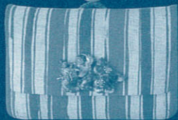
《腰差したばこ入れ》