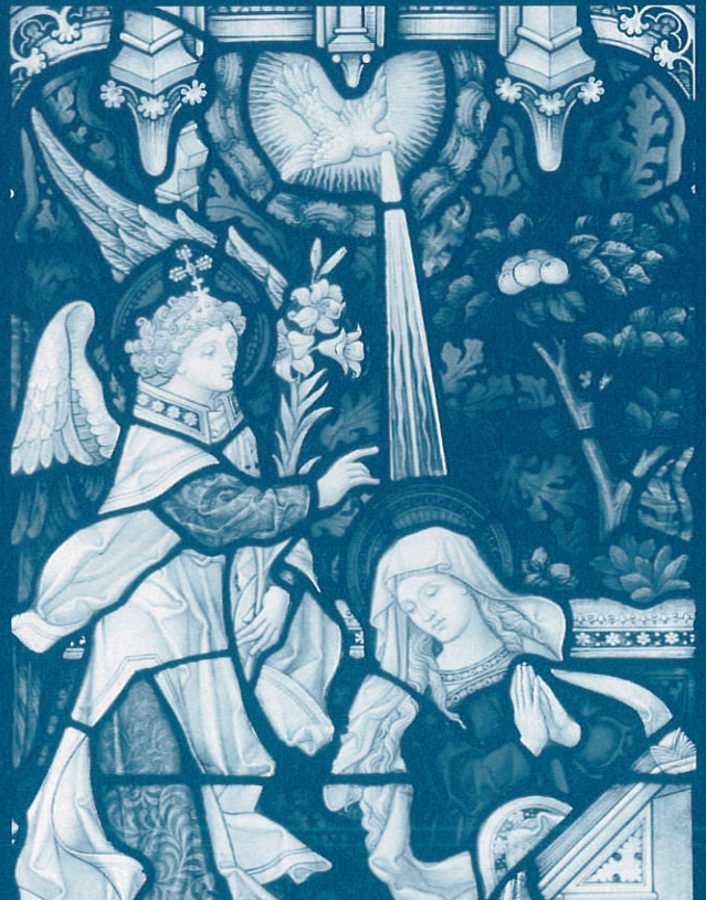
《「受胎告知」クレイトン&ベル工房》