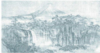
《白糸瀑圖》村松以弘 静岡県指定文化財 [後期展示]

この夏はぜひ美術館に足をお運びいただき、掛川の歴史文化の魅力をお楽しみください。