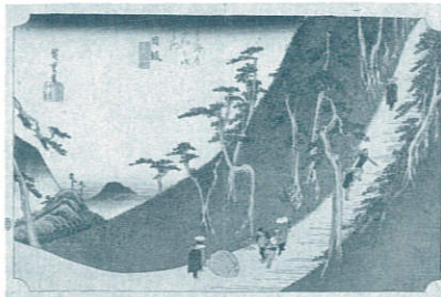
《東海道五拾三次之内 日坂》(保永堂版)歌川広重