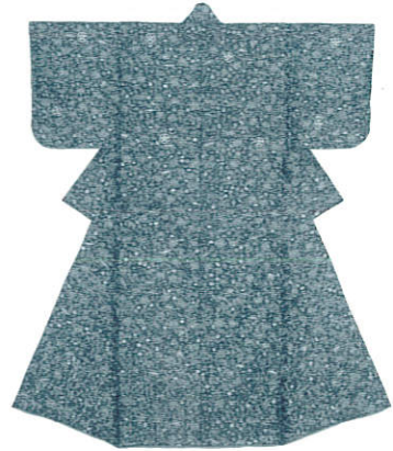
《黒紅緑緯地宝文様腰巻》