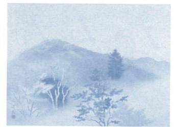
《秋の山》小野 竹喬 1950年頃