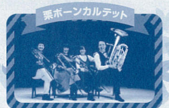
栗ポーンカルテット