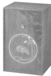
「薬地竹に鶴図螺鈿蒔絵茶道具入れ」大正時代