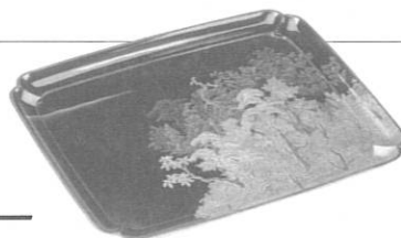
「松林図蒔絵平盆」明治時代

※身体障がい者手帳、療育手帳、精神障がい者保健福祉手帳を所持する方とその介護者1名は無料 ※しずおか子育て優待カード・掛川得パスポート利用可