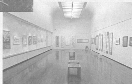
令和元年度 掛川市民芸術祭優秀作品展