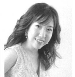
山本夏子(ソプラノ)