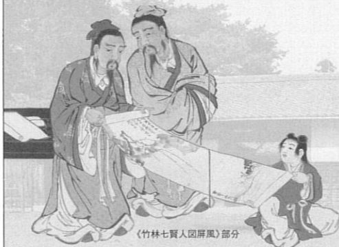
〈竹林七賢人図屏風〉部分