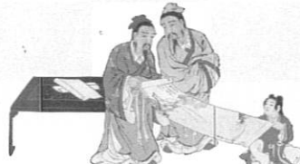
《竹林七賢人図屏風》(部分)