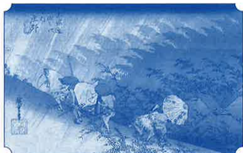
《保永堂版 東海道五十三次之内 庄野》