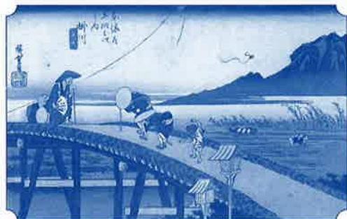
《保永堂版 東海道五十三次之内 掛川》

会期中イベント「作品解説」 日時 11月3日(水祝)10時～14時、各回30分 無料(ただし、当日の観覧券が必要となります) 定員10名 当日整理券配布(先着順)