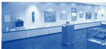
令和2年度掛川市民芸術祭 優秀作品展