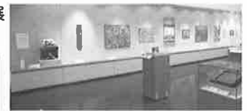
令和2年度掛川市民芸術祭 優秀作品展