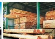
上原工場木材乾燥場