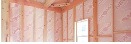
壁全面に施工された断熱材 ネオマフォーム

弊社開発のEH2工法(次世代高断熱住宅+耐力壁工法)は、省エネ対策等級4の性能を有する工法であることが認定されています。等級4とは、国が定める温暖化抑制基準の最高ランクであり、弊社のような小企業が独自工法で認定されているのは全国的にも極めて稀な例です。弊社では、1990年代後半には次世代高断熱住宅を開発、建築し、弊社の標準工法となっており、これは国土交通省の定める2025年省エネ基準を既にクリアしています。EH2工法は、その断熱性能の高さから、冷暖房機の数等を削減することができ、冷暖房機購入費、光熱費削減にもつながります。