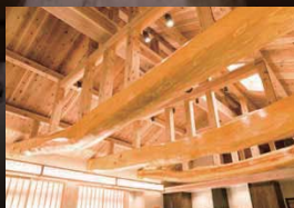
リビングの美しい梁は、樹齢1000年超えの島根県産の地松を使用。この太さだからこそ、3間の幅を柱無しで支えられるそう。