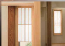
材木店からスタートした白川建設だからこそ叶う、貴重なイチイの床柱。無塗装の天然色ならではの凛とした美しさがある。