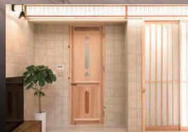
リビングの扉や、内障子、照明は部屋の雰囲気にあわせてオーダーメイド。職人の細かな手仕事を感じられる。