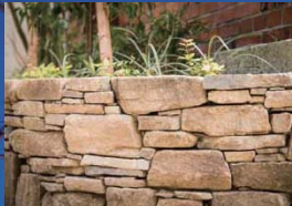
天然石の個性をそのまま活かした「コバ積み」が、よりナチュラルで表情豊かな空間をつくりあげている。