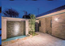
ライトアップされた庭は、風の雰囲気とは一味違う落ち着いた雰囲気を感じ出す。こだわりのライティングもこの庭の見所。