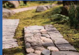
天然石の味わいはもちろん、石を割るためにできた「セリ矢」の跡をそのまま活かした大島石も風情がある。