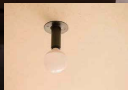
無垢の木と漆喰が美しい和室には、あえて銅製のレトロな照明をコーディネート。モダンなインテリアとの相性も良い。