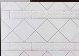
水まわりにはインポートもののタイルを採用。三角形に割ったものを組み合わせることでより個性的なデザインに仕上げている。