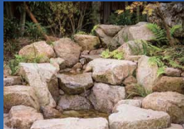
山の中の小さな沢をイメージ。流れ落ちる水の音に聞き入れれば、大きな安らぎが心を満たしてくれる。