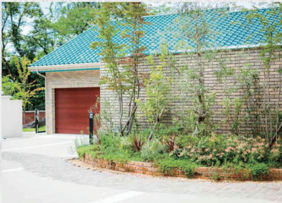
自然のままの「雑木林」は春夏秋冬ごとに姿を変え、暮らす人の心を毎日楽しませてくれる。