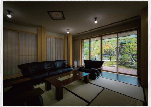
和空間から一枚の絵のように鑑賞できる「庭」が存在することで、日々の暮らしが豊かに。