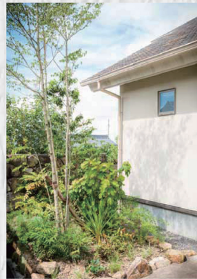
建物裏のスペースにも木々を配して、家全体を緑で包みこむ工夫を。(白川建設ギャラリー)