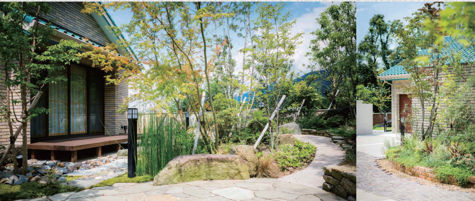
小鳥のさえずりで春の訪れを知り、蝉の声で夏を知る。音でも季節を感じられる喜び。