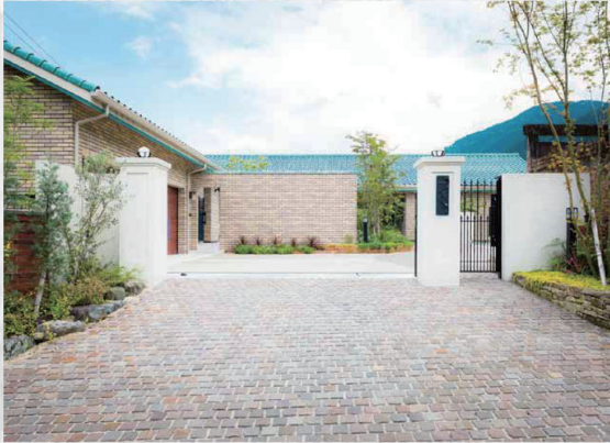
エントランスを広く、華やかにみせてくれる緑の脇役たち。密やかに咲くちいさな花たちもお客様をお出迎え。