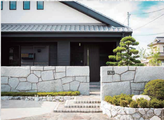
個性の強いエントランスも、バランスよく緑を置いて優しくナチュラルな雰囲気。(新居浜市N様邸)