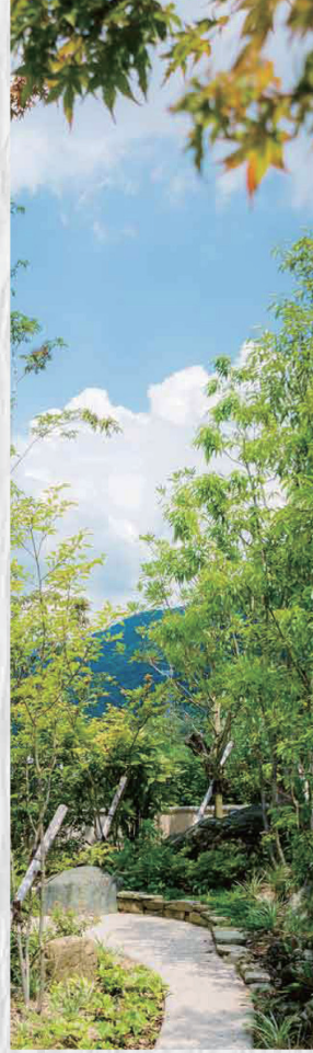
日々変化をとげる季節の香りを届けてくれる、しなやかな風の通り道。