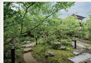
昔からある石も活用。年月とともに苔も成長し、庭に深みを持たせている。