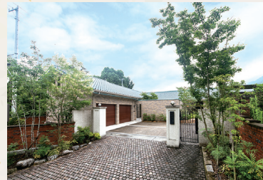
この土地にとけこむよう設計していった展示場の入り口。約100年前のリメイク壁もある。