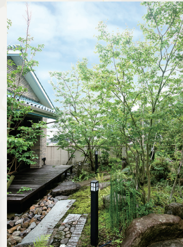
庭から見た住まい。ウッドデッキを設けて、庭と家とのつながりを持たせた。