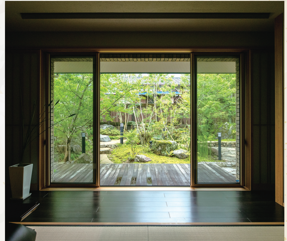
この住まいを設計する上で、一番こだわったのが庭。他のどこよりも和室からの眺めを優先し、それから各居室の配置を考えていった。和室から見る庭は絵画のようで、新緑や紅葉など表情豊かに季節の移り変わりを告げる。