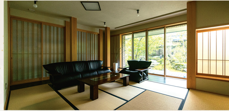
和室には、書院、床の間、広縁を設けた。掃き出し窓からは、庭を眺めることができる。檜の化粧柱も見どころ。