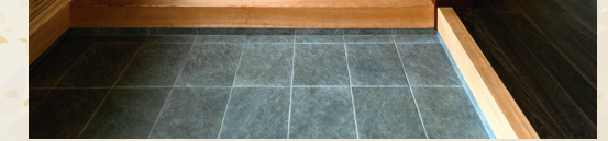
玄関ホールは広く取り、扉を開けた瞬間に白川建設の特徴である「木の家」が体感できる。造作の壁面収納も空間美を担う。