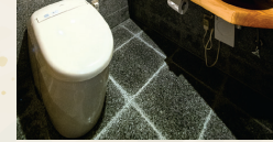
トイレの出入り口には、目隠しの壁を立ち上げた。