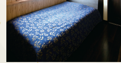
各個室と収納は、杉の無垢材を使用。調湿、脱臭効果が高い。