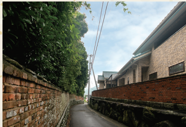
左は国の重要文化財の広瀬邸で、右が展示場。調和するようにレンガの壁をデザインした。