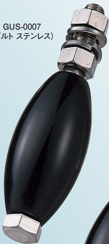
GUS-0007 (ボルト ステンレス)