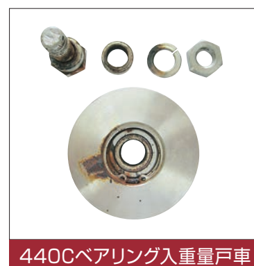
440Cベアリング入重量戸車