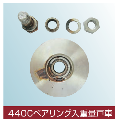
440Cベアリング入重量戸車